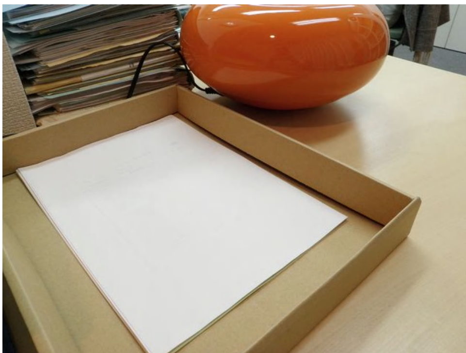
【裏紙回収ボックス】