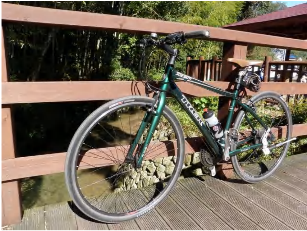
【通勤及び裁判所への往復に使用している自転車】