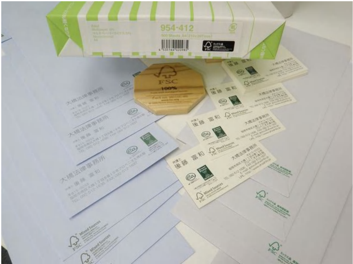
【FSC森林認証を受けた名刺、封筒、コピー用紙、コースター】