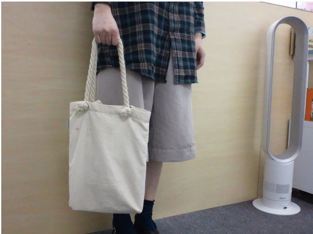
【エコバックを利用】