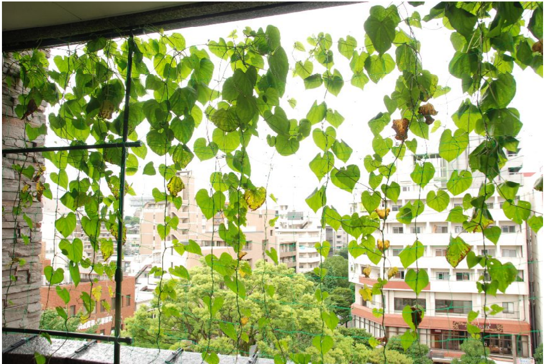
【グリーンカーテンの導入】