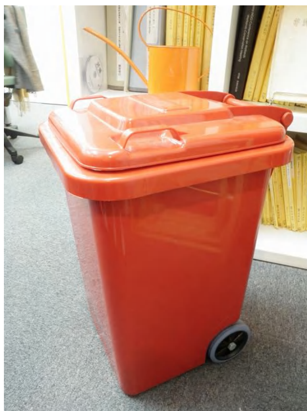
【古紙回収保管ボックス】